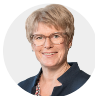
Prof. Dr. Veronika Grimm

Mitglied im Sachverständigenrat – Professorin an der Technischen Universität Nürnberg (UTN)