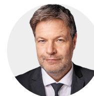
Dr. Robert Habeck

(CDU/CSU), Ausschuss für Umwelt, Naturschutz, nukleare Sicherheit und Verbraucherschutz