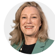
Gillian Martin Schottische Energieministerin