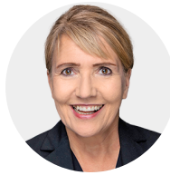
Dr. Simone Peter

Präsidentin – Bundesverband Erneuerbare Energie e.V.