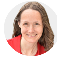
Dr. Ingrid Nestle Mitglied der AG Klimaschutz und Energie – Bündnis 90/Die Grünen