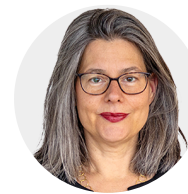
Dr. Nina Scheer

Sprecherin der AG Klimaschutz und Energie – SPD